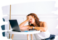
Problem: She wishes she'd... She wishes she hadn't...

Jakie problemy mają ci ludzie? Napisz zdania z konstrukcją "wish + had / hadn't".