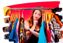
Problem: She wishes she'd... She wishes she hadn't...

1 Complete the gaps with an adverb in the box.